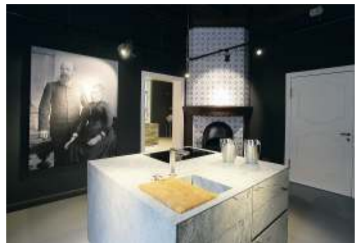
Blick in einen Ausstellungsraum der Villa: Hinten ist noch ein alter Kamin zu sehen.