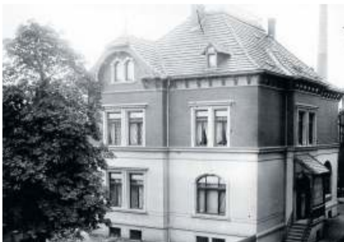
Eine Aufnahme der Direktoren-Villa der Büssing-Werke aus dem Jahre 1904.