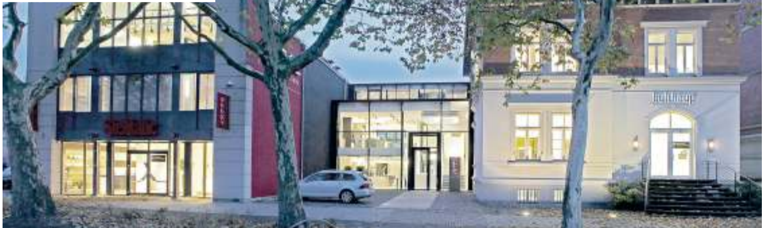
Die Firma „Joppe – Exklusive Küchen“ im Heinrich-Büssing-Ring 34 in Braunschweig. Über den gläsernen Verbindungsbau und mittels eines Fahrstuhls gelangen die Kunden in die Villa.